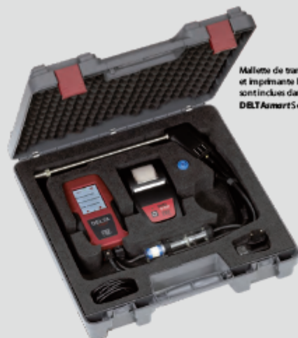
Malette de transport ABS et imprimante haute vitesse sont incluses dans le modèle DELTA smart Set