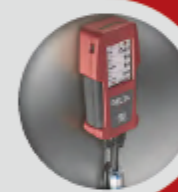
Utilisation mains libres, analyseur équipé de 4 fixations magnétiques sur la face arrière