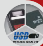
Mémorisation, transfert et impression des mesures avec au choix, micro carte SD, mini USB et bluetooth (transmission sans fil vers smartphone ou tablet) ou imprimante Infrarouge