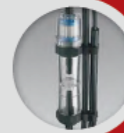
Grand pot à condensation et filtre Téflon anti poussières