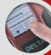
Écran tactile couleur rétro-éclairé. Menu intuitif de guidage à travers tous les programmes de mesure