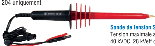
Sonde de tension SHT40KV

Tension maximale assignée : 40 kVDC, 28 kVeff ou 40 kVcrête Rapport de division entrée/sortie : 1 kV/1 V